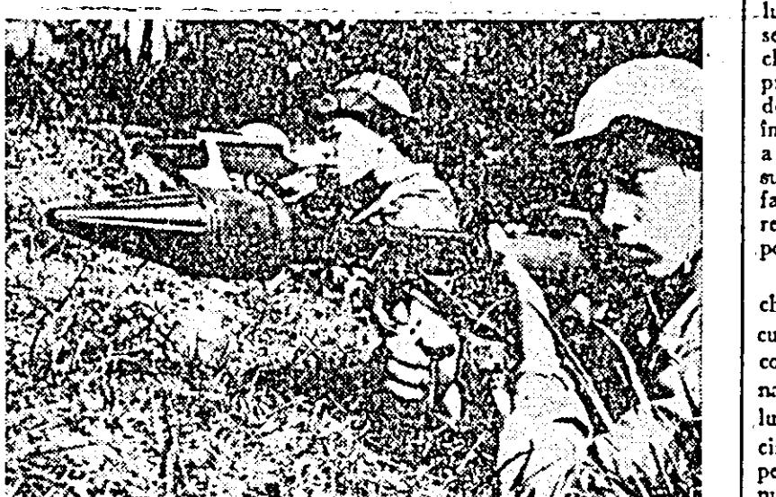
Cu armele anti-tanc în poziție de tragere, patrioții sud-vietnamezi așteptînd o coloană motorizată americană.

PASADENA 9. (Agerpres). — Nava spațială americană „Lunar Orbiter 4” care s-a înscris pe o orbită polară în jurul Lunii avînd apogeul de 6.064 km și perigeul de 2.683 km este gata, după cum anunță specialiștii NASA, să transmită fotografiile ale celor două fețe — vizibilă și invizibilă — ale satelitelui natural al Pămîntului.