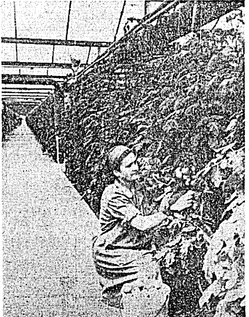
Aspect din interiorul Combinatului de sere.