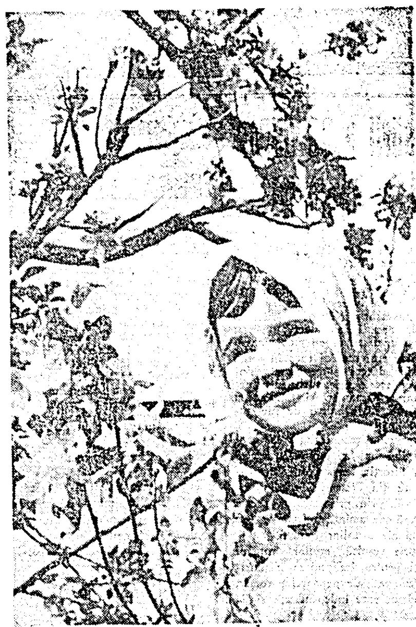
Flori de mal.

IOAN ANDRA, activist al Comitetului rațional de partid