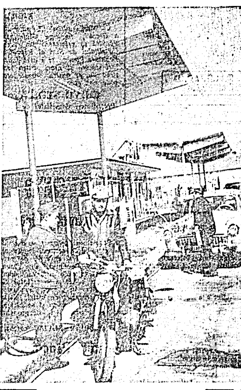
Depozitul din Arad al Bazei nr. VIII Timișoara a obținut realizări frumoase în muncă, fiind fruntaș pe bază. IN CLIȘEU: aspect cotidian la o stație de benzină.