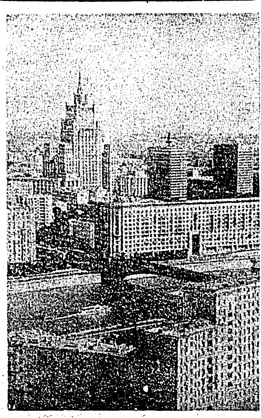
U.R.S.S. — În fotografie: Moscova. Vedere spre faleza Smolensk.

arătat Ly Van Sau. Purtătorul de cuvînt a menționat apoi refuzul SUA de a demonta ba- zele lor militare din Vietnamul de sud simulația cu retragerea personalului militar american, adăugînd că acces- ta demonstrare intenția Statelor U- nite de a spori potențialul militar și Administratiei saigoneze.