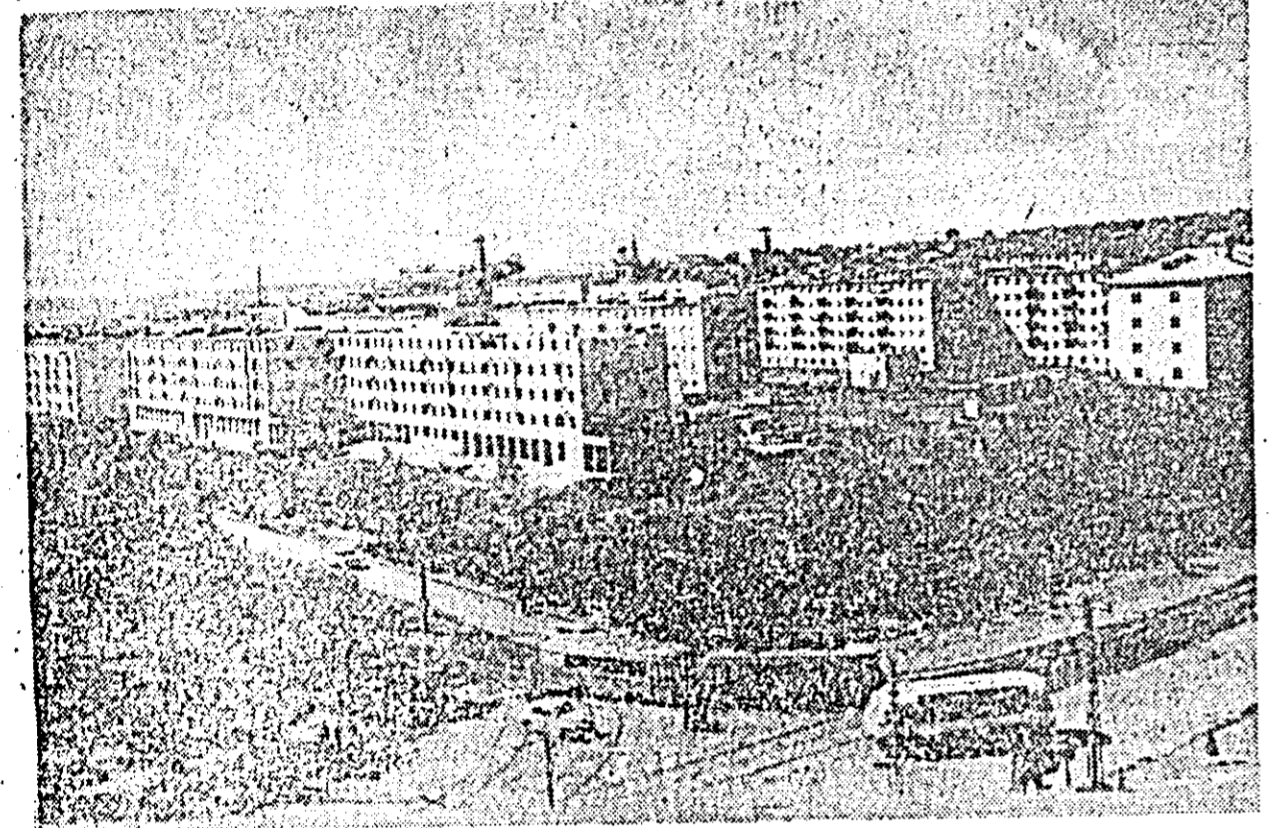
Cliseul înfățișează strada Kirov din Celebink unde se construiesc numeroase blocuri pentru muncitorii Combinatului electro-metalurgic.

COPENHAGA 28 (Agerpres). La 27 august s-au încheiat la Copenhaga convorbirile dintre președintele ministrului al Franței, Georges Pompidou, și primul ministru al Danemarcei, Jens Otto Krag. Agenția France Press precizează că cei doi șefi de guvern au examinat situația internațională, problemele Europei occidentale și alte probleme de interes comun. Acestei agenții relevă din unul din principalele subiecte dezbătute a fost dezvoltarea schimbărilor comerciale și culturale între cele două țări.