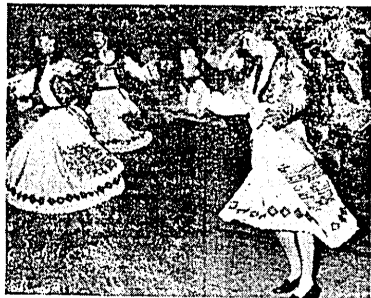
Formația de dansuri populare a întreprinderii de mănăstire pe scena Festivalului național „Cântarea României”.

Respectul față de valorile culturale este un semn ce dovedește conștiința de sine a unui popor. Cu acest gând, împlinindu-se la 22 iunie 125 de ani de la nașterea lui Ioan Russu Șirianu, se cuvine să-l reamintim în amintirea noastră pe acest fiu al tinutului arădean, care în epoca în care a trăit a fost un participant activ la toate evenimentele social-politice și culturale ale timpului său.