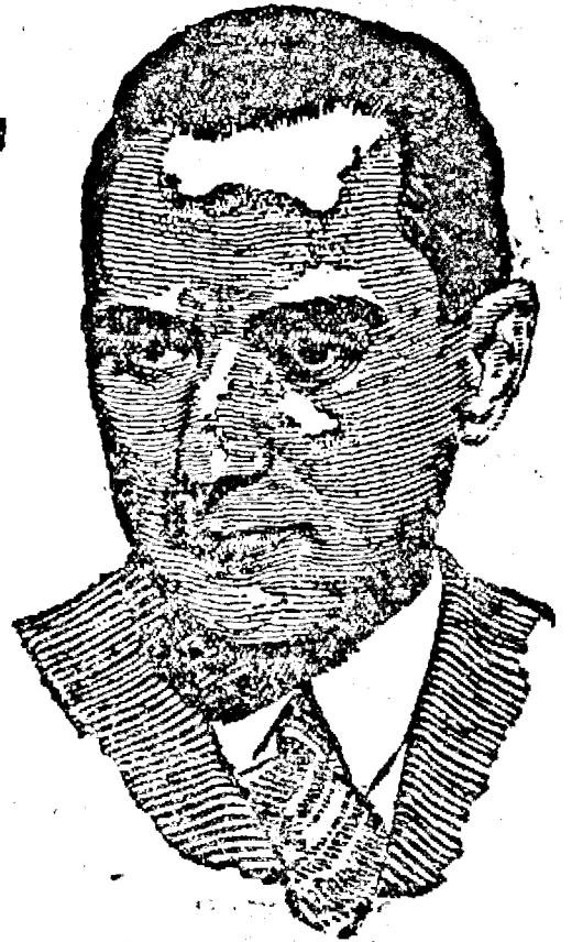
D. prof. Mihai Antonescu vicepreședintele Consiliului de miniștri

Urarea lor este a întregului neam românesc.