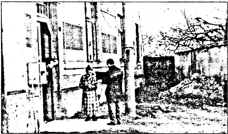
Pământul scos din pivniță „înfrumusețează” locul din fața casei...