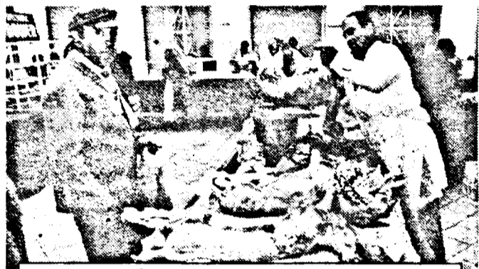
Un vânzător norocos

Consumatorii care aleg varianta mieilor vii pot apela la serviciile unor asociații