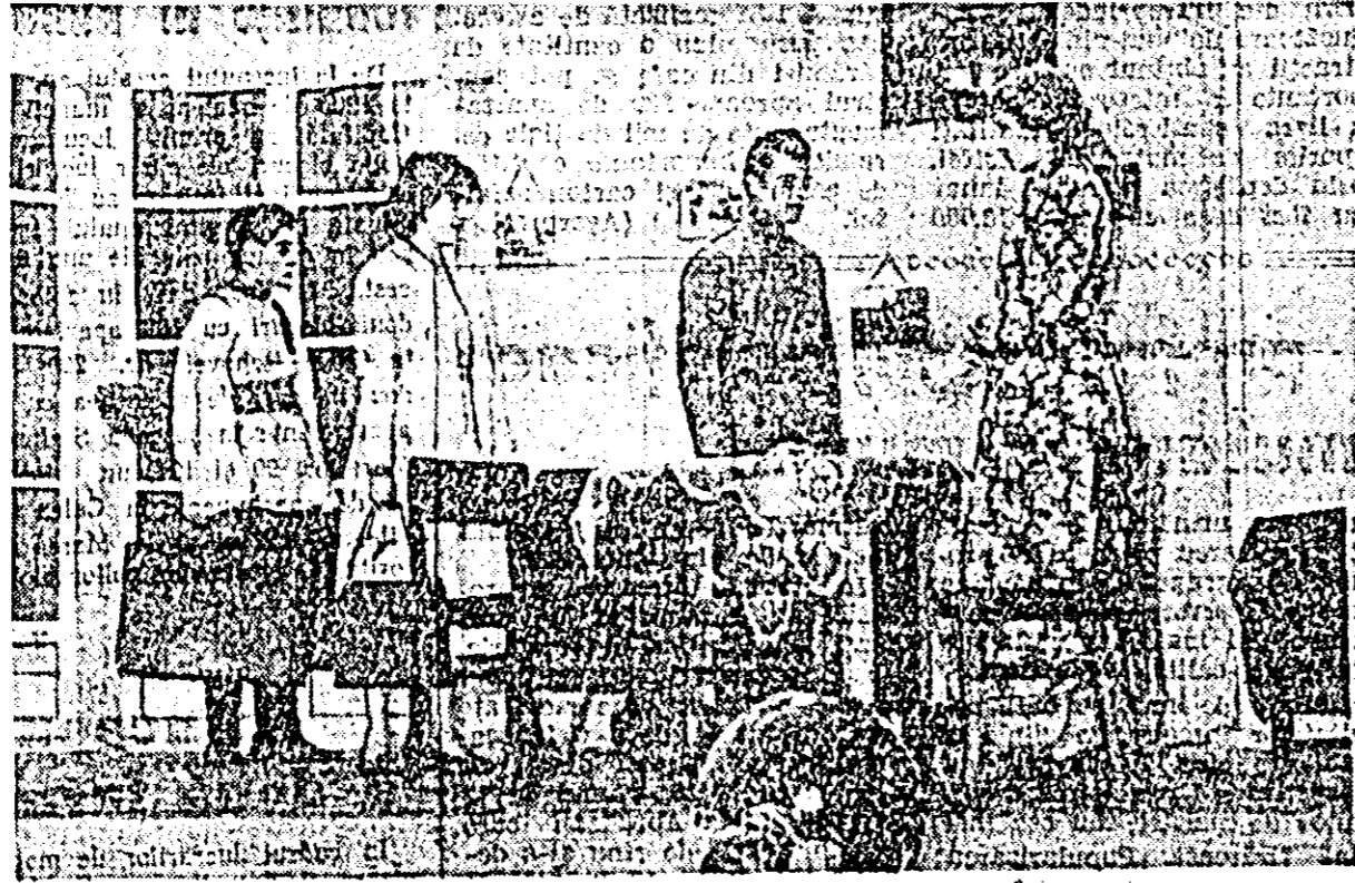
Clișeul reprezintă o scenă din spectacolul „Intr-un ceas bun” de V. Rozov, prezentat cu mult succes de artiștii amatori de la „30 Decembrie”.

Vestitul comic, mim și clown Popov urmează să apară în ro-lul principal într-o coproduc-ție sovieto-franceză a filmului Candide. Amintim că satira lui Voltaire este ecranizată pentru prima oară.