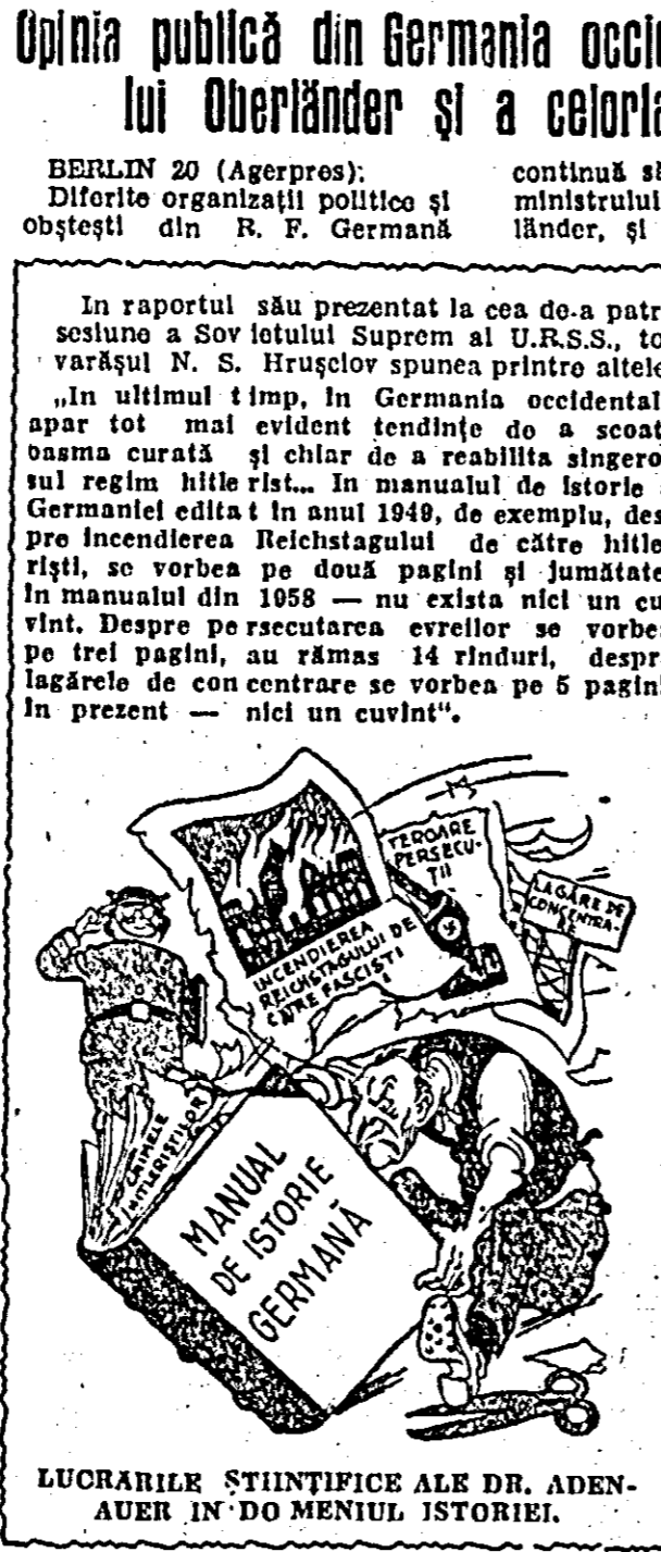
LUCRĂRILE ȘTIINȚIFICE ALE DR. ADENAUER ÎN DO MENIUL ISTORIEI.

Subliniînd necesitatea imperioasă a acestei conferințe, comitetul de organizare atrage atenția asupra primejdiilor deosebite ce decurg din politica de înarmare a Bundeswehrului vest-german.