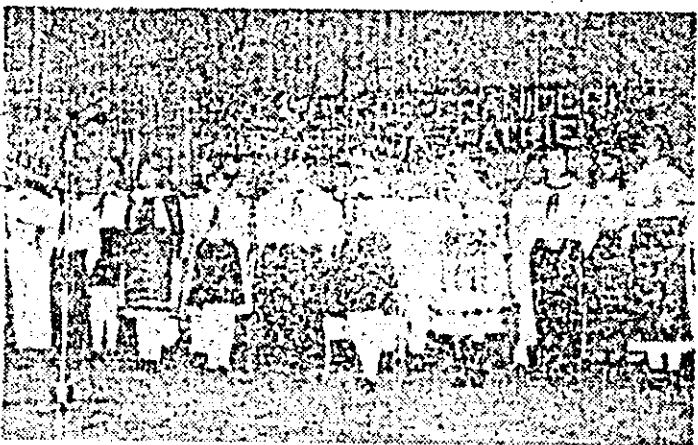
Cu prilejul predării albumului stafetă „Alături de grîniceri, de strajă patriei” între județul Timiș și județul Arad, pionierii cercului „Prietenii grînicerilor” din Nădlac au prezentat un frumos program artistic.

• La Moneasa își desfășoară activitatea, în aceste zile, două tabere de instruire a pionierilor. La una participă pionierii președinți ai asociațiilor sportive școlare, iar la alta — pionierii membrii ai formațiilor de instrumen-