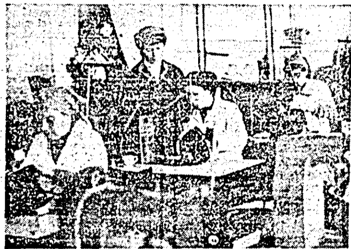
Întreprinderea „Libertatea”. Aspect de muncă în atelierul croi-cusut.

Acționind susținut pentru realizarea exemplară a indicatorilor de plan — ce le-au revenit, colectivele de oameni ai muncii care și desfășoară activitatea în cadrul unităților, aferente Uniunii Județene a cooperativei meșteșugărești Arad au încheiat anul 1988 cu un bilanț bogat în realizări. Astfel, producția marfă a fost îndeplinită în proporție de 101,8 la sută; prestările de servicii către populație — 103,8 la sută; livrările de mărfuri către fondul pieții, 103 la sută, iar la export — 109,2 la sută. La obținerea acestor realizări, o contribuție deosebită și-au adus-o colectivele de muncă de la cooperativele meșteșugărești „Arta meșteșugarilor”, „Precizia”, „Artex”, din municipiul Arad, cît și de la „Prestarea” Pîncota și „Mureșul” Lipova.