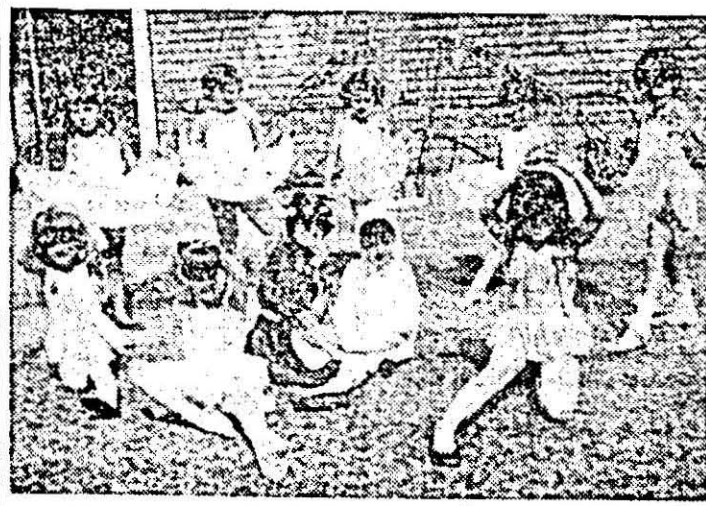
Moment coregrafic de la serbarea Grădinișei p.p. „Tri-coul roșu“.

● La sala festivă a C.J.O.P. Arad a fost vernisată, luni, cea de-a II-a biennială interjudețeană de artă fotografică pionierescă sub genericul „Copilărie fericită în anii Epocii de aur“. Sînt expuse lucrări reprezentative din 11 județe ale țării.