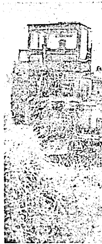
Preșele de balotat paie acționează și ele din plin la eliberatul terenului.