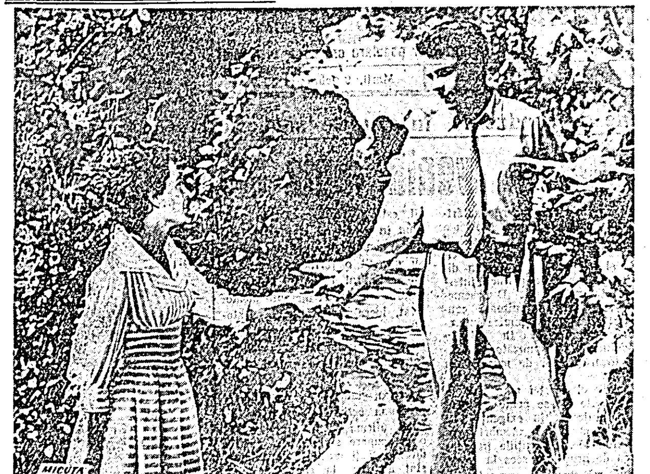
IN CLISEU: O scenă din film.