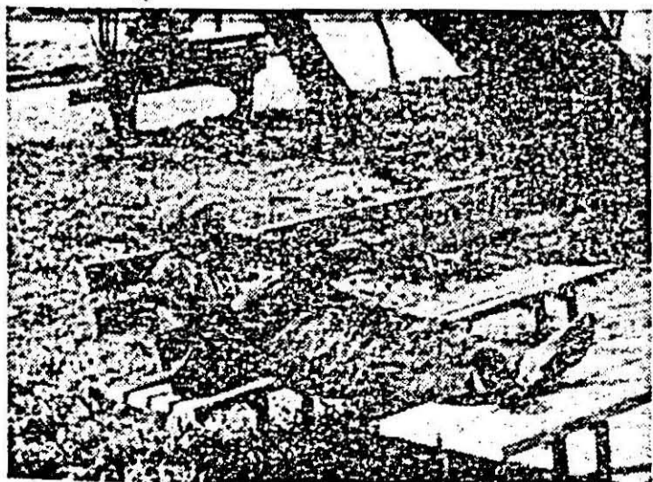
Cum înțeleg unii să jolo sească parcul...