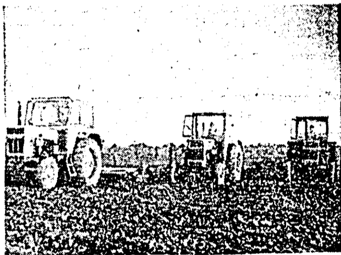
În C.U.A.S.C. Nădlac, mecanizatorii dau zor cu pregătirea terenului creînd condiții pentru a încheia semănatul grîului în câteva zile.