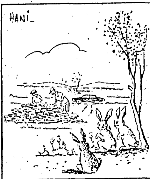
Atenție, băieți! a apărut concurența! Carticatură de H. TEODORESCU

Direcția Județeană de poștă și telecomunicații anunță abonații din municipiul Arad că factura telefonică a lunii octombrie se va încasa numai pe baza buletinului de identitate al titularului postului telefonic. Pentru a se evita aglomerația de la casieria principală, abonații sînt invitați să se prezinte la oficiile P.T.T.R. din raza de domiciliu.