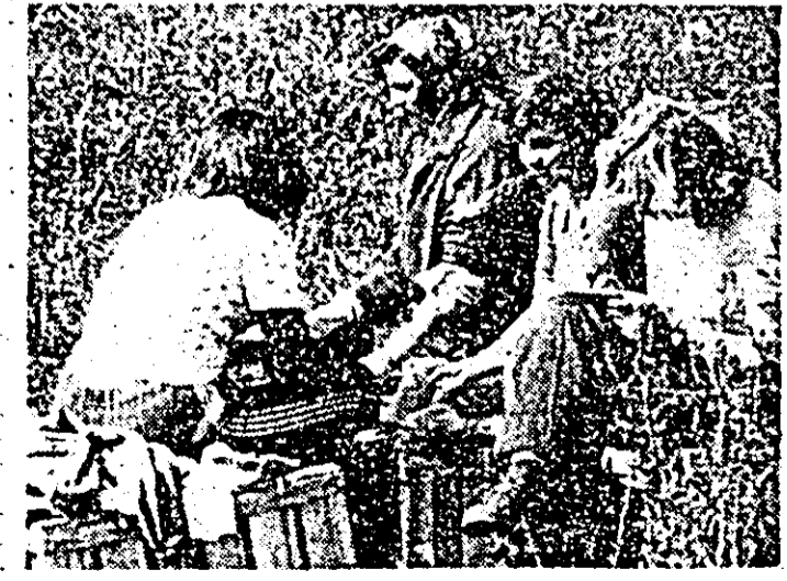
Și elevii liceului „Ioan Slavici” își aduc contribuția la strîngerea roadelor toamnei.