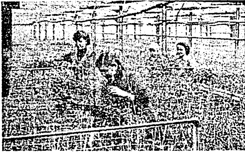
Terma nr. 6 a A.E.C.S. se re Arad. De aici pleacă spre florăriele municipiului cînașele garoale pe care le oferim celor drați.