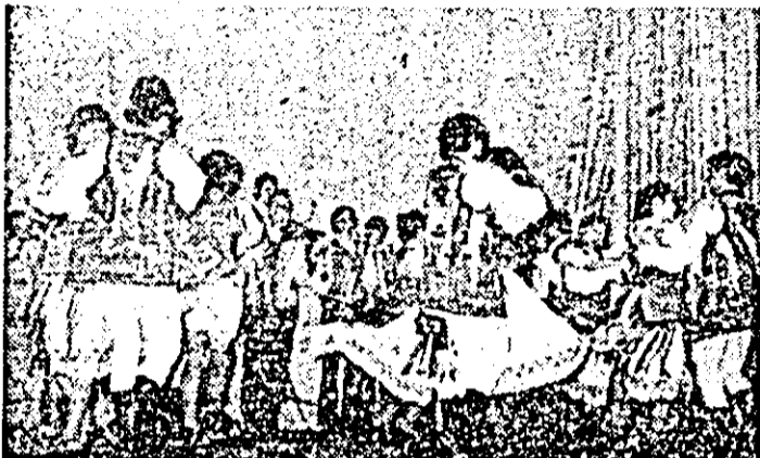
Ansamblul folkloric al Casei de cultură a municipiului pe scena fazei de masă a celei de a IV-a ediții a festivalului muncii și creației libere.