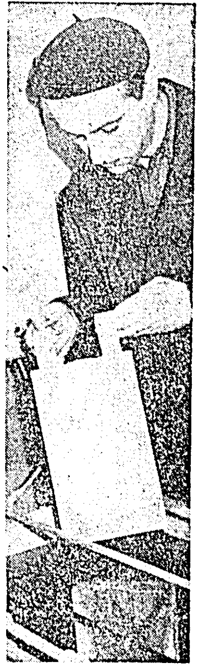
În secția de nichelaj a atelierelor CT 5 lucrează și utemistul Ferdinand Post. Lucrările efectuate de el sînt de calitate superioară.

În fotografie: tovarășul Ferdinand Post la locul său de muncă, lângă bala de nichel.