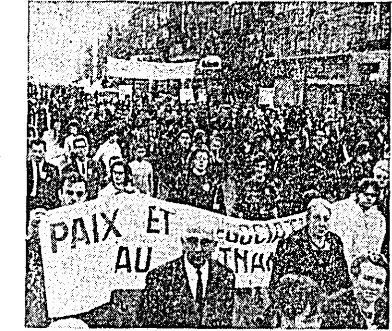
La Bruxelles a avut loc o demonstrație de masă împotriva războiului. 30.000 locuitori ai capitalei Belgiei au manifestat pe străzile orașului cerînd încheierea unui pact de neagresiune între țările membre ale NATO și ale Tratatului de la Varșovia, încetarea experiențelor și interzicerea armii nucleare, reducerea cheltuielilor militare în Belgia. În FOTOGRAFIE: un aspect din timpul acestei demonstrații.

ROMA 19 (Agerpres). — La Bologna a avut loc o mare demonstrație a oamenilor muncii la care au participat 30.000 de persoane. Participanții la demonstrație, veniți din mai multe provincii italiene, au condamnat agresiunea SUA și au cerut restabilirea păcii în Vietnam. Luînd cuvîntul la miting, Cesare