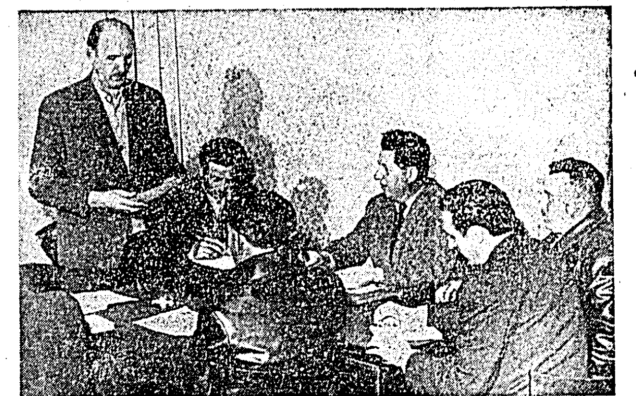
În timpul consfăturii

Joi, 22 aprilie, orele 17, vor fi prezenți la Cabinetul de partid toți tovarășii încadrați la studiul individual organizat pe lângă cabinetul de partid.