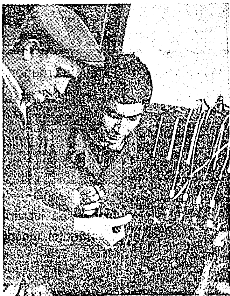
Elevii Școlii profesionale de mecanici agricoli care fac practică în secția de pompe injective a SMT Pecica...