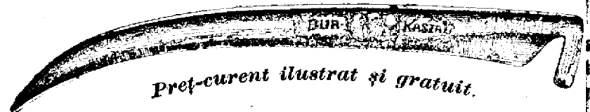
Preț-curent ilustrat și gratuit.

Coasa de oțel „Bur“ numai atunci este veritabilă, dacă mâner poartă gravată inscripția aceea: W. G. Kőbánya , iar latul ei este tipărită marca firmei cum arată figura asta: 190 4—2