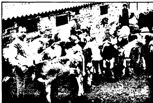
Dorel Nini alături de cei 60 de vițel din microferma de la balastiera Micălaca