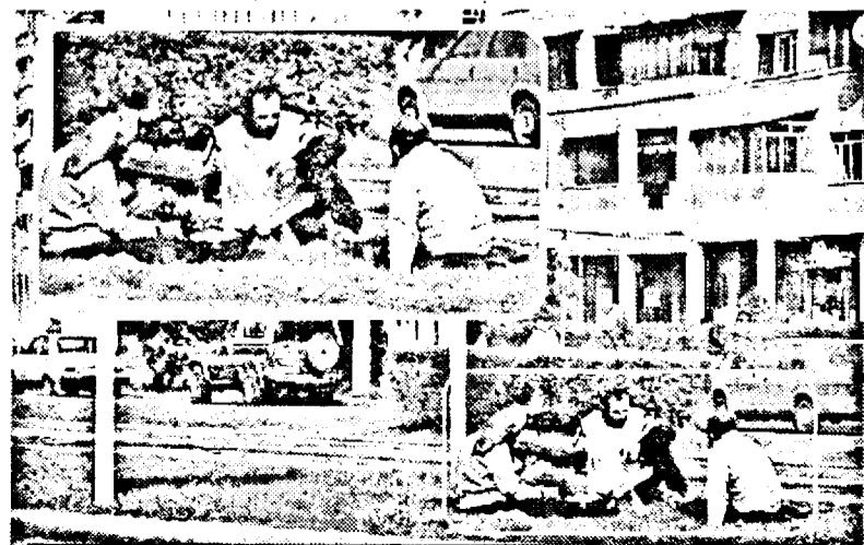
Siesta comunitară