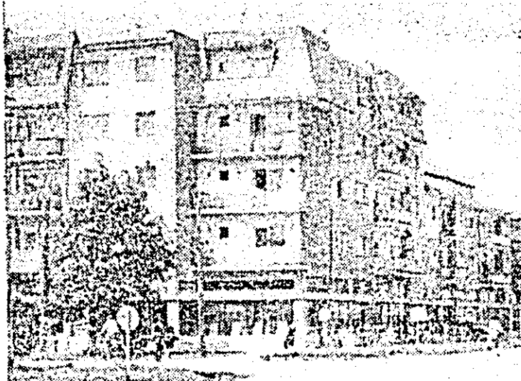
Imagie din Nădlacul de azi.