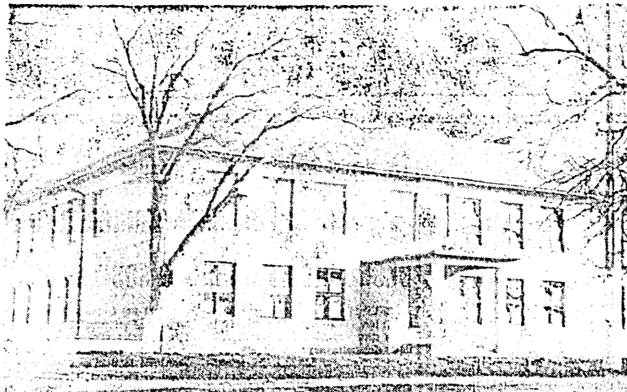
În județul nostru baza materială a învățământului se dezvoltă mereu. În imagine noua construcție a Școlii generale din Sîmpetru-German.

Filiala invită pe tovarășii care urmează să primească autorizație să se prezinte la sediul din B-dul Republicii 43 pentru unele indicații absolute necesare la ridicarea mașinii.