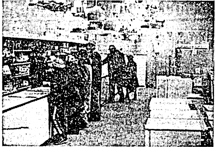
Secvență cotidiană în magazinul nr. 113 — electrice al I.C.S. mărțuri Industriale.

Cooperativa „Ighena” a deschis în stația Mărășești nr. 75, o unitate de cofașuri, iar în complexul cooperatîei meșteșugărești din cartierul Bujac s-a deschis o unitate de frizerie.