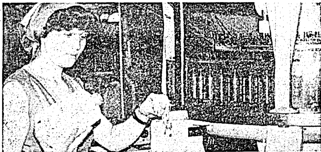
Fruntașă în întrecere, utecista Emilia Iepure de la „Tricoul roșu” realizează depășiri de plan de circa 8 la sută și execută produse de calitate superioară.