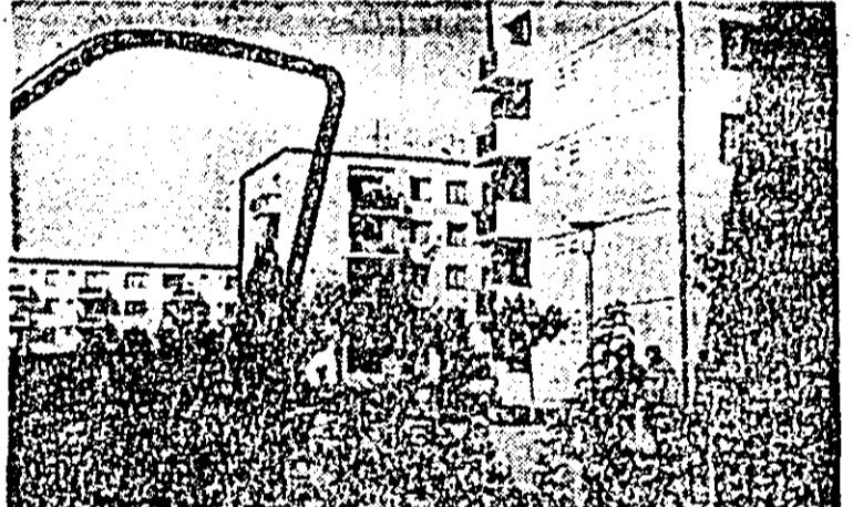
Vara la înou.