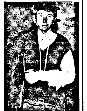
Mâna din fabulă