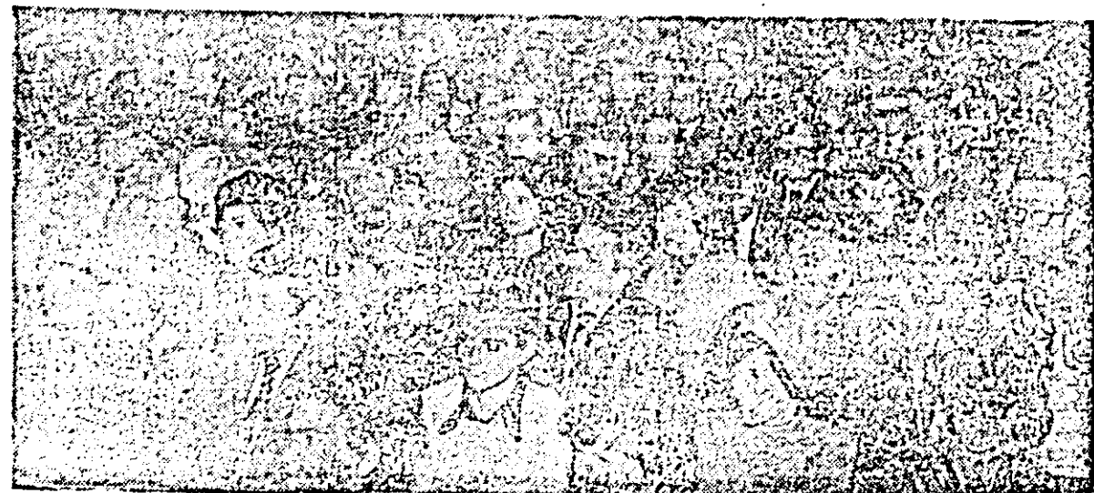
Aspect din timpul desfășurării lucrărilor conferinței.