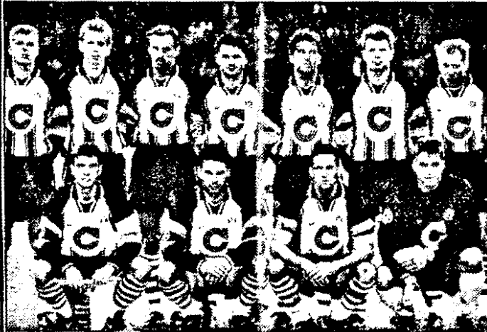
Borussia Dortmund - campioana Europei, echipă cu pretenții la titlu în noul sezon.

o satisfacție deosebită: Schalke 04 câștiga Cupa UEFA după o acerbă dublă confruntare cu Internazionale Milano, iar Borussia Dortmund devenea regina Europei, detronând Juventusul chiar în finala Ligii Campionilor. Astfel la startul cupele europene din acest an, Germania alinază nu mai puțin de opt echipe: Bayern München, Borussia Dortmund și Bayer Leverkusen în Liga Campionilor, VfB Stuttgart în Cupa Cupelor, VfL Bochum, Karlsruhe, 1860 München și Schalke 04 în Cupa UEFA. Ținând cont că F.C. Köln, Duisburg și Hamburg sunt la un pas de a câștiga locurile calificate din Interfoto se pare că și în noul sezon germanii vor monopoliza eurocupele. Noul sezon competițional,