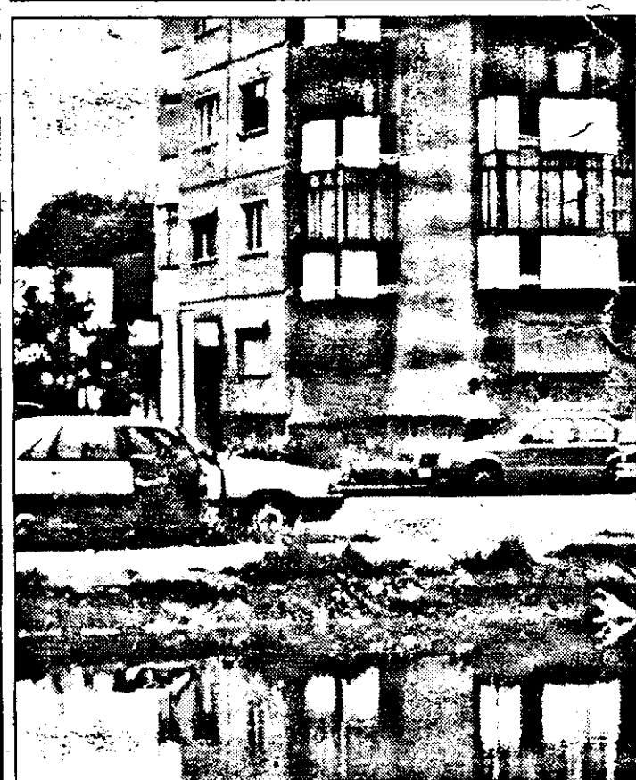
PE BANUL MĂRACINE, ÎN ZILELE NOASTRE: PEISAJ LACUSTRU CU... BLOCURI!

Prețul unei încărcături de gaz la domiciliu este de 36.000 lei, atât în mediul urban cât și rural.