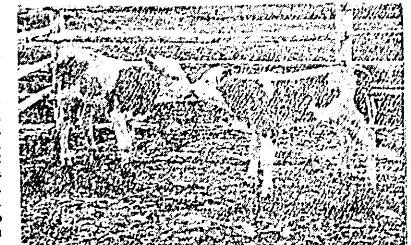
În clipse: Istă doi viţei obţinuţi prin însămîncări artificiale la secţia gospodăriei agricole de stat Aradul Nou. Ei sînt frumoşi, violi, bine dezvoltaţi. Şi celălalt viţel obţinut prin această metodă sînt la fel de dezvoltaţi.