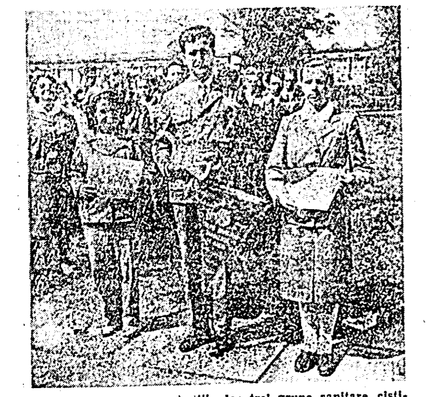
În clipse: reprezentanţii celor trei grupe sanitare cîştigătoare ale concursului.

În urma omologării rezultatelor, juriul a acordat steagul roşu, cupa şi diploma de grupă fruntaşii grupelor sanitare de la fabrica „Răsăritul” Pincota, care a totalizat 19,10 puncte. Pe locul doi s-a clasat grupa de la gospodăria colectivă din Vladimirescu, iar pe locul trei — grupa de la gospodăria colectivă din Dorobanţi.