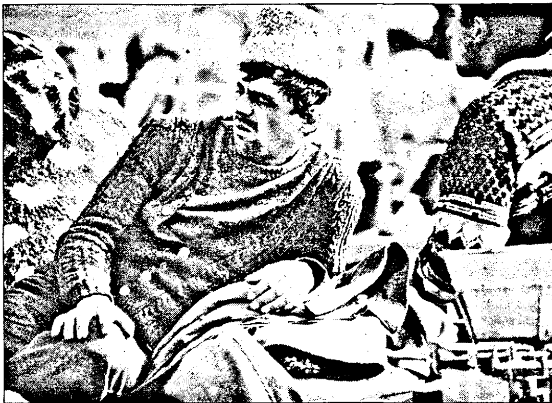
„Oare ce pot cumpăra pe un kilogram de cartofi?”