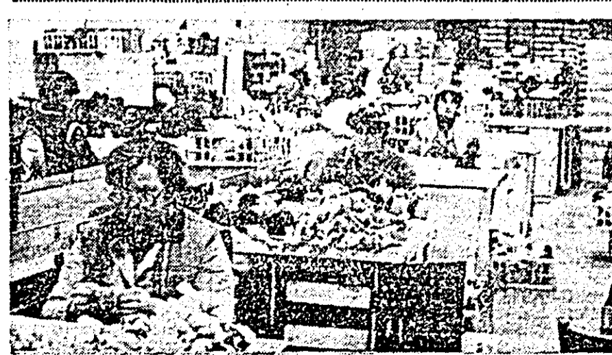
Aspect de muncă în una dintre secțiile frunțase ale întreprinderii „Arădeanca” — secția montaj — finisaj păpușl.