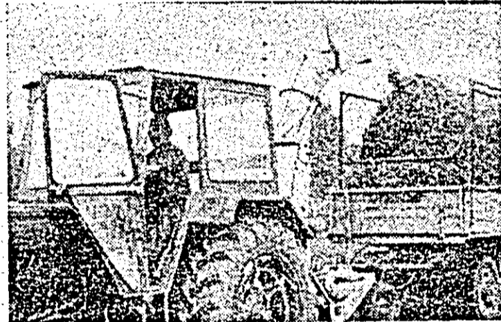
În C.U.A.S.C. Perica se recoltează masa verde pentru furaje.

verde, ca bunăoară, Petru Rareș, ar putea fi recoltate în aceste zile cantități însemnate de iarbă, lucru pe care însă gospodarii nu se grăbesc să-l facă. Iată de ce este necesar să se treacă operativ, cu toată hărnicia, de către toți cei care au încheiat contracte, fie unități agricole, fie crescători de animale individuali, la cositul și adunatul ierburilor de pe fiecare metru pătrat al fișijilor ce se întind pe marginea drumurilor, canalelor și viroașelor de tot felul, realizînd furaje suplimentare și valoroase pentru animale.