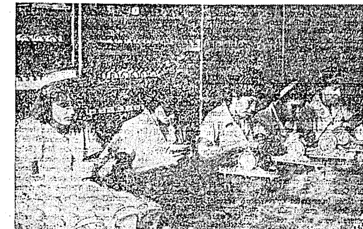
Lucrătoare de la fabrica de ceasuri „Victoria” prin desoinicia lor întăresc prestigiul fabricii.