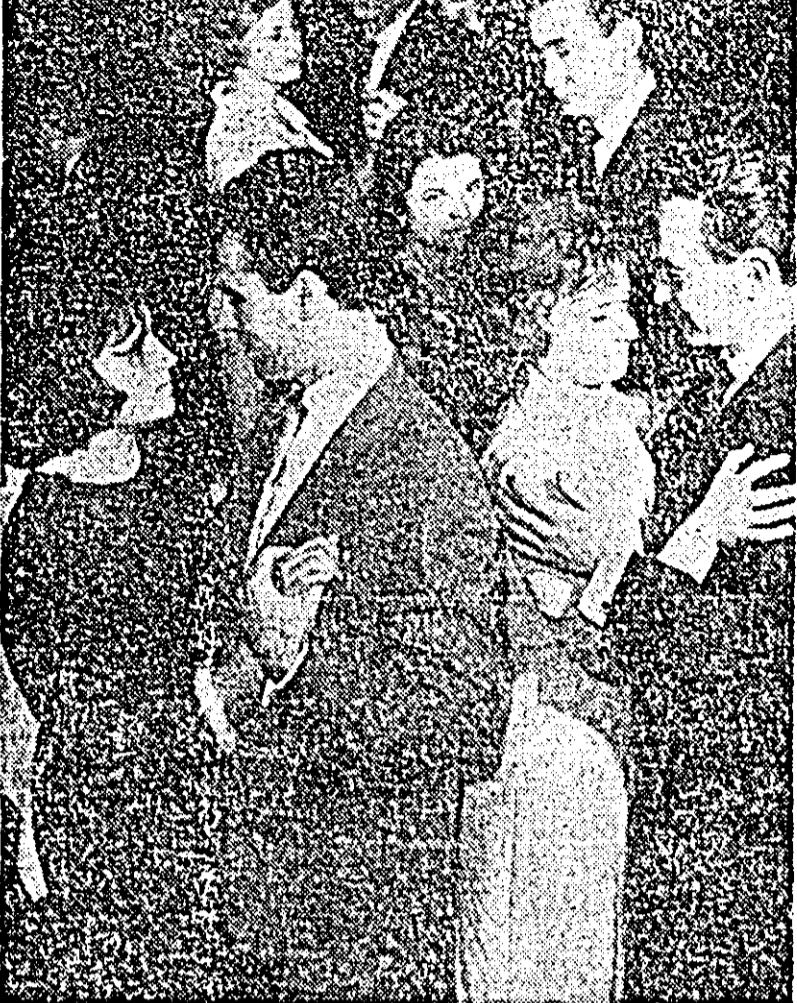
In ritmul dansului s-au prins zece de perechi. Noaptea anul nou 1966 este sărbătorită într-o atmosferă de generală bună dispoziție la clubul Uzinelor de vagoane.