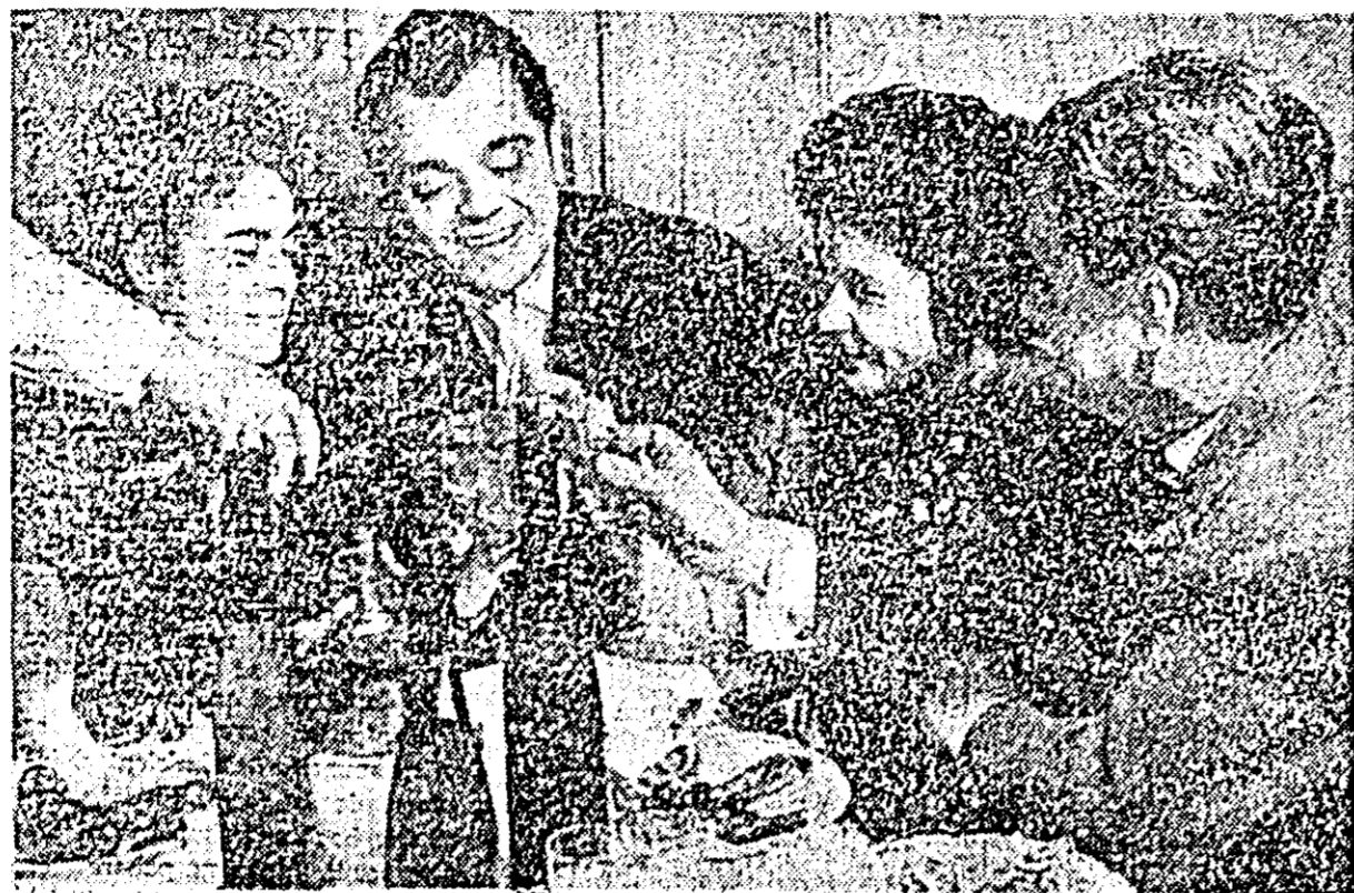
Moment solemn. Noul an a găsit voie bună și veselie și printre constructorii de vagoane din orașul nostru.

...Timpul a trecut pe nesimțite. În zorii, înainte de a se despărți, cei peste 100 de muncitori, ingineri și tehnicieni ceferiști înving ultimul dans. A fost o noapte frumoasă, o petrecere de neuitat.