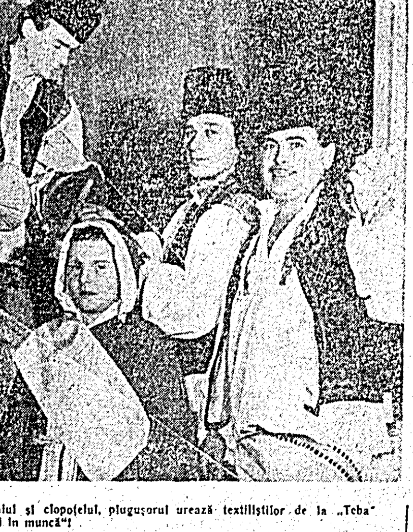
După datina străbună, cu buhalul și clopoțelul, plugușorul urează textiliștilor de la „Teba” „La mulți ani, fericitie și noi izbînzî în muncă!”