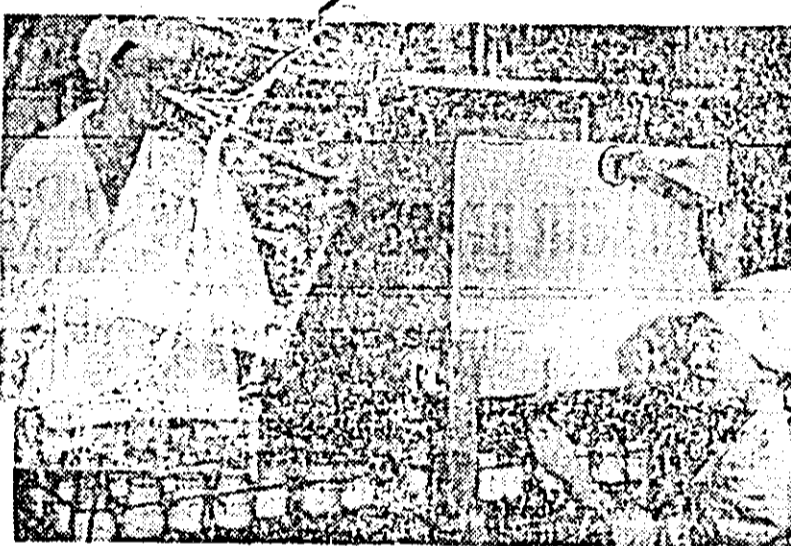
Zilnic pe poarta întreprinderii de colectare și industrializare a laptelui...