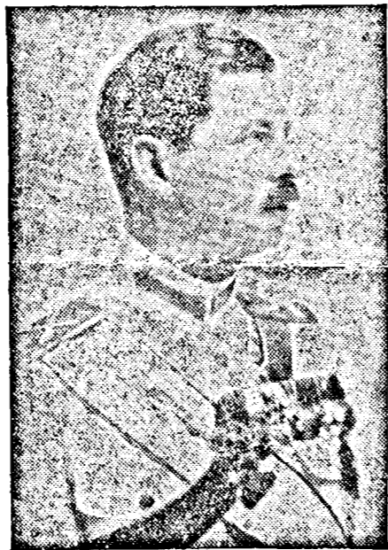
M. S. Regele Carol al II-lea opiniei publice este bine cunoscută, se ocupă în mod stăruitor de România, de poli-

...tica ei externă, de raporturile cu țările vecine și de stările launtrice sub noul regim.