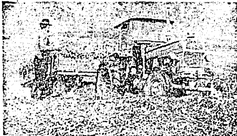
Aspect de la însilozarea furajelor la cooperativa agricolă de producție din Felnac.

Trebuie, de asemenea, utilizate cu randament maxim tractoarele la executarea arăturilor adînci de toamnă. Întrucît sînt de arat peste 11 000 hectare. Dacă la I.A.S. Șagu, Cermel, Lipova, „Mureș”, „Scinteia” și Semlac, arăturile sînt pe cale de a se încheia, la Pecica, Fintinele, Ineu, Chișineu Criș ritmul de lucru nu este satisfăcător existînd încă mari suprafețe ne-