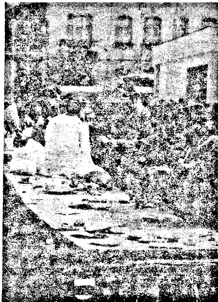
După privatizare, se poate minca oricum?