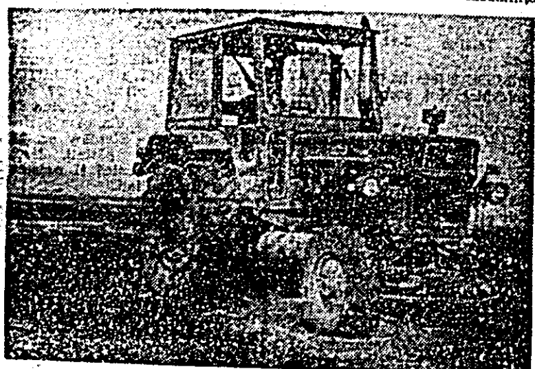
Mecanizatorii de la I.A.S. „Scintela“ pregătesc un bun pat germinativ pentru recolta acestui an.