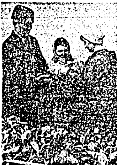
La ferma legumicolă a C.A.P. „Lumea Nouă“ Cutilci se alege cu grijă răsădul de varză timpurie.

Se acționează, de asemenea, intens pentru înființarea de noi plantații de vițel-de-vie. La Gașca s-au plantat deja primele hectare cu butași pentru struguri de vin, din cele 10 planificate. Tot cîte zece hectare au de plantat și cooperativele agricole „Șiriana“ din Șiria, Mîșca și Covășint, unde, însă, nu s-a făcut pînă acum decît pichetatul terenului, ceea ce impune să se ia măsuri de intensificare a lucrărilor.