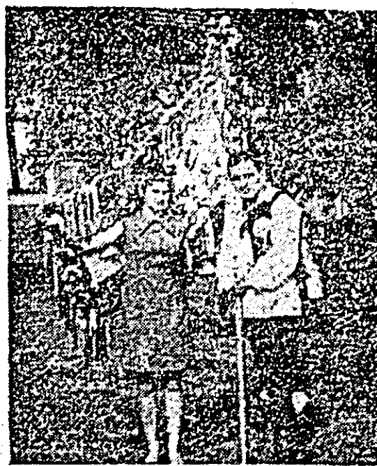
În fotografie: tineri cu steag.

La Cued, sat aparținător de comuna Buteni, oamenii au statornicit, în ultimile șase decenii, o sărbătoare destinată fiilor lor, legați de trecerea în starea de fecior apt pentru serviciul militar. Așa spunea unul dintre bătrînii satului, Extrem de interesantă este desfășurarea unui astfel de ceremonial. În primul rînd există o fază de pregătire, cînd tinerii aflați în pragul recrutării stabilesc locul de desfășurare a petrecerilor, orchestra care li va însoți, fetele ce vor împodobi steagul, pregătirea jucătorilor de steag, chemarea oaspeților din afara satului, precum și alte amănunte.