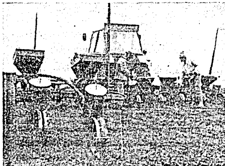
În unități din C.U.A.S.C. Arad. Semănatul porumbului — pe ultimele suprafețe.

cinci noi produse printre care: contorul de impulsuri, mecanismul de înregistrat diagrame liniare și obiectivul cu distanță focală variabilă, și că producția a fost realizată cu cheltuieli — totale și materiale — sub nivelul stabilit. În fruntea înțrecerii pentru îndeplinirea în mod exemplar a sarcinilor acestui an hotărâtor al cininalului, se situează colectivele secțiilor strunguri automate și montaj.