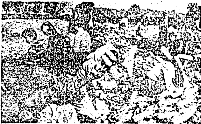
Elevi ai școlilor generale din Șicula și Gurba în plină activitate la depănșutul porumbului.

re. Tot pînă duminică, arăturile pentru învâmînțările de toamnă s-au efectuat pe 91 la sută din suprafața planificată, iar terenul a fost pregătit pe 84 la sută din cit este prevăzut la culturile de toamnă. De aceea, trebuie grăbit semănatul grîului, lucrarea fiind realizată pe 63 la sută din suprafața stabilită, rezultate mai bune fiind înregistrate în consiliile unice Pecica, Felnac, Sîntana și altele. Există condiții ca prin intensificarea la maximum a semănatului, lucrarea să se încheie în cursul acestei săptămîni pentru a se asigura condiții favorabile pentru recolte înalte în anul viitor.