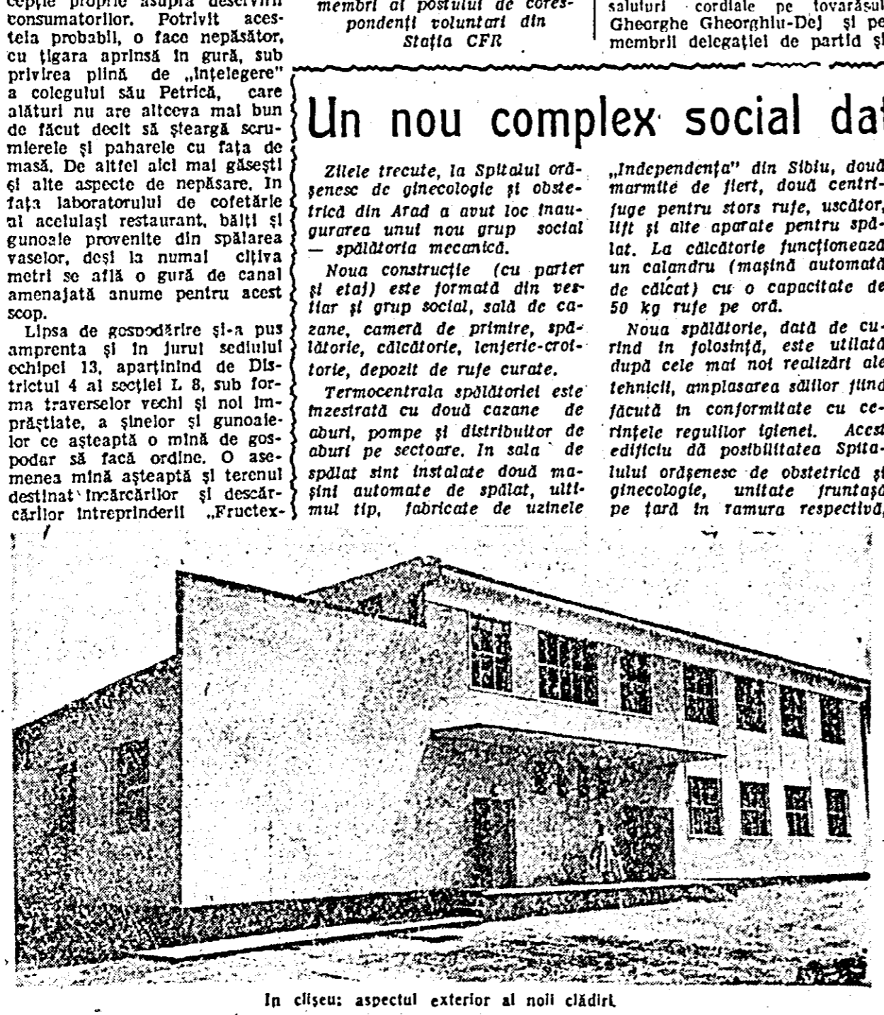
În clădire: aspectul exterior al noii clădiri

...Mai sînt și altele Da, am mai întîlnit, din păcate și alte aspecte nu tot atât de plăcute, am întîlnit și alți oameni. Unul dintre aceștia și la punctul alimentar al stației. Aici, printre mezelurile atrinse în galantar, printre alimentele expuse în vitrină, muștele se plimbau în vole, nestingherite de nimic, căci vinzătorul, după