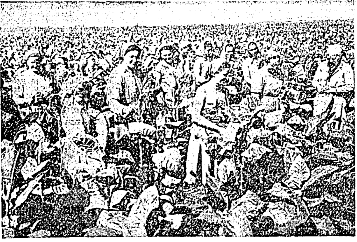
Colectivistiții din Zimanduc au acordat atenția cuvenită culturii de tutun, cu care s-a însămințat o suprafață de 8 ha. Astfel, ei au aplicat 3 prașile, iar acum frunzele ajunse la maturitate sint culesse.