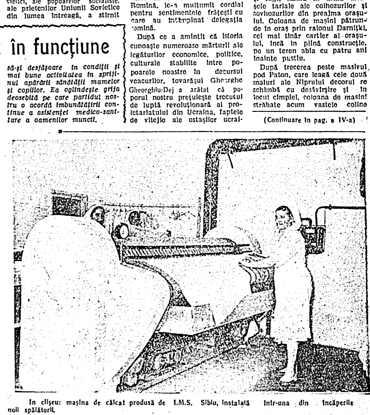
În clădire: mașina de călcat produsă de I.M.S. Sibiu, instalată într-una din încăperile noii spălătorii