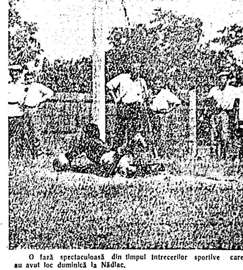
O fază spectaculoasă din timpul întrecerilor sportive care au avut loc duminică la Nădlac.