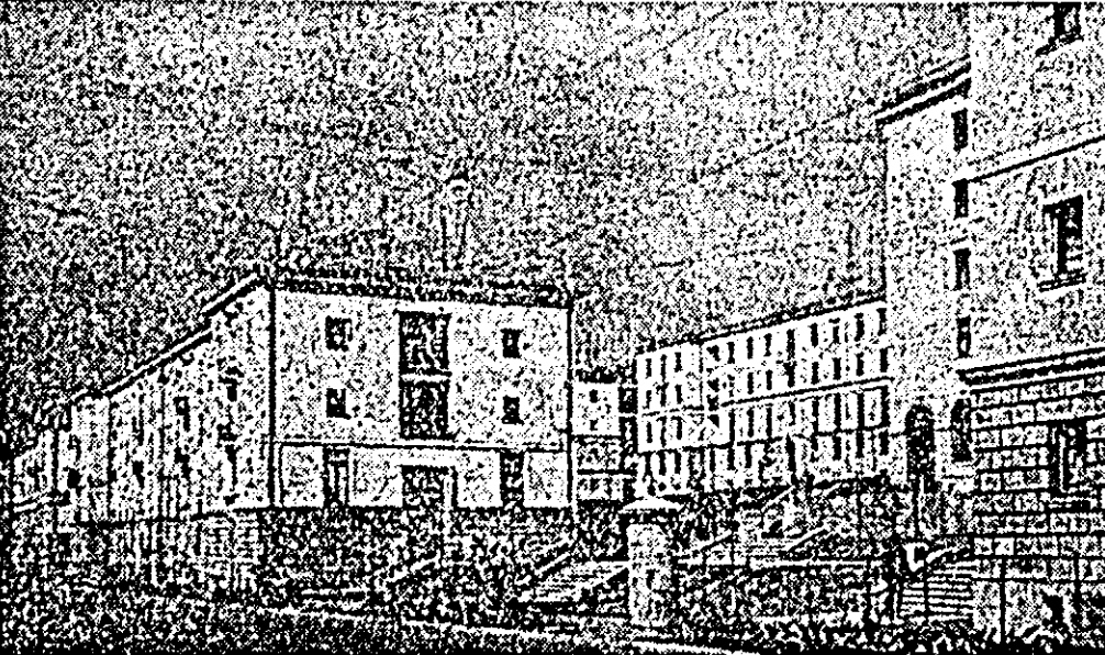
Cartierul Păcurari din Iași astăzi. Toate aceste blocuri de locuințe au fost construite în anul regimului democrat-popular.

Dotarea cu noi utilaje de mare mecanizare revizuirea permanentă a proceselor tehnologice de lucru și ridicarea stării tehnice a liniilor de garaj industriale au dus la creșterea gradului de mecanizare a operațiilor legate de manipulara mărfurilor în gară. Astfel, cele aproape 60 stații de cale ferată care sînt înzestrate cu poduri-bascule și alte utilaje moderne de manipulare mărfurilor au creat posibilitatea ca peste 75 la sută din operațiile de încărcare-descărcare să se efectueze în prezent mecanizat.