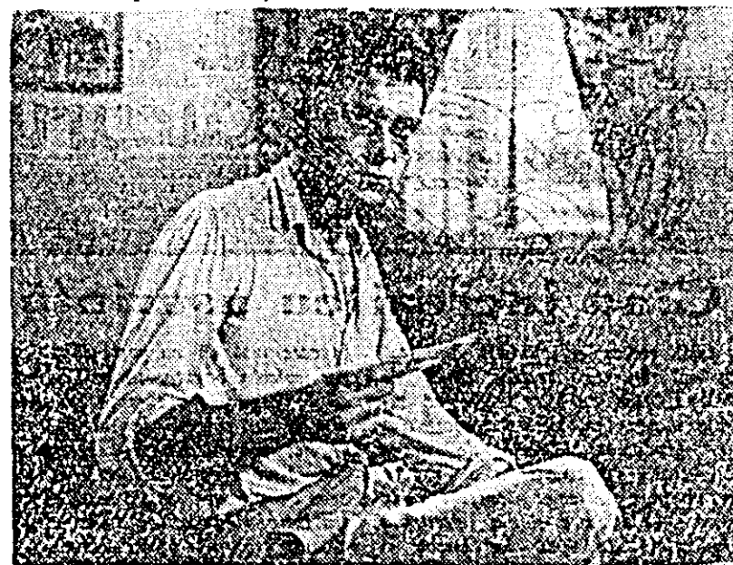
ÎN CLISEU: O secvență din film.

— o producție a studioului cinematografic „București”