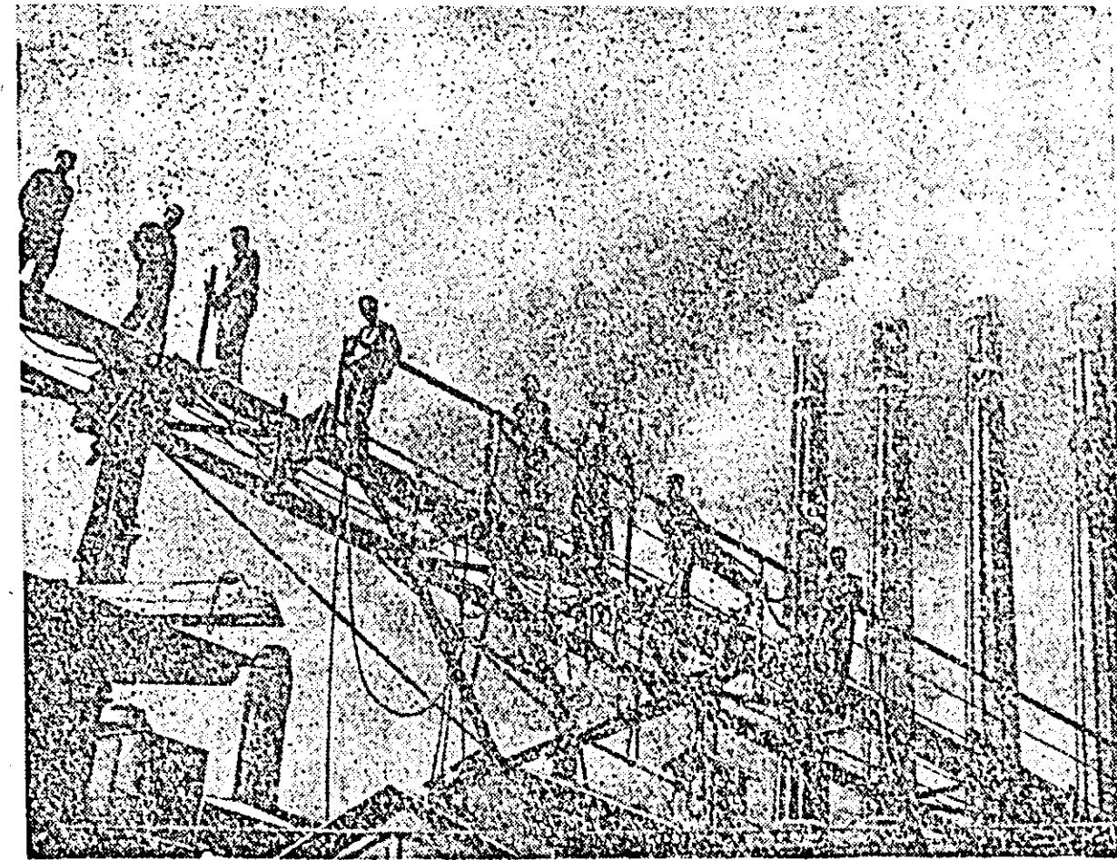
An de an fabrica de ciment din Turda se modernizează, mărindu-și pe această cale capacitatea sa de producție. În clișeu echipa de montori constructori la înălțime.