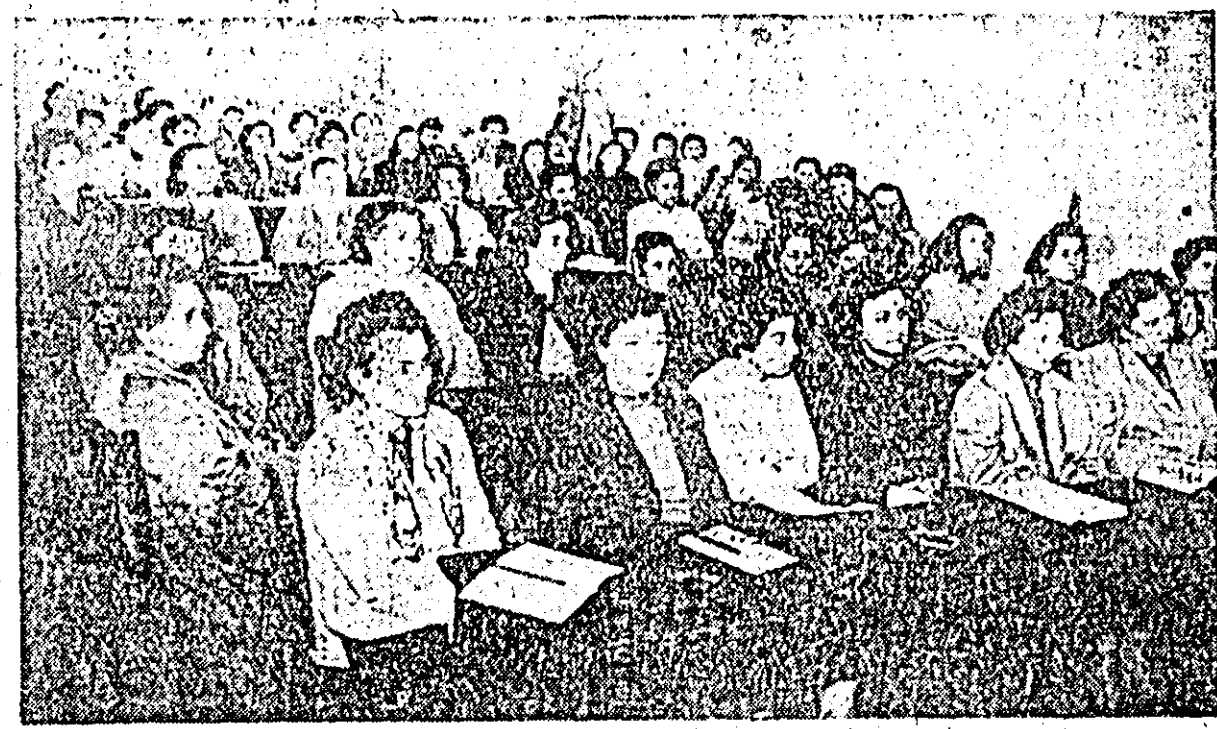
ÎN CLISEU: un aspect de la Plenara Comitetului orășenesc al femeilor.

O ramură importantă în cadrul gospodăriei este și creșterea animalelor. Echipa de construcții lucrează intens la ridicarea grajdului de bovine pentru 170 capete. Pînă în prezent s-au procurat un număr de 91 vaci și junoci iar alte 35 sînt în curs de cumpărare.