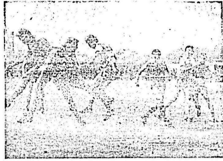
Fază din meciul Strungul — Minerul Cavnic.

ce minierii „pîndesc” faza de contraatac și — în final — se avîntă spre egalare, în vreme ce localnicii par resemnați (și mulțumiți?) cu scorul minim de 1-0. Oricum, era totuși prima victorie în acest început de campionat, era și primul gol al