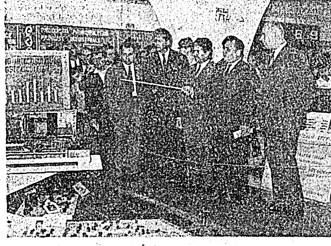
Se vizitează standurile expoziției.

Hotărîrile luate la cel de al X-lea Congres al P.C.R. au deschis noi și strălucite perspective țării noastre, inaugurînd o nouă perioadă de muncă pentru întregul popor, o etapă de noi realizări de seamă în toate domeniile de activitate. S-a afirmat astfel că țelul fundamental al politicii partidului este extinderea și modernizarea bazei tehnico-materiale, perfecționarea relațiilor socialiste de producție, săvîrșirea societății socialiste multilaterale dezvoltate.