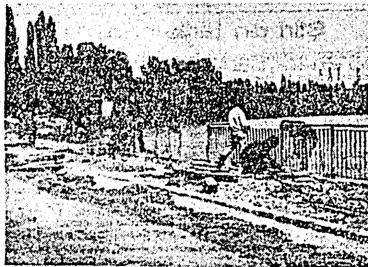
Se intrumusețează malul Mureșului.