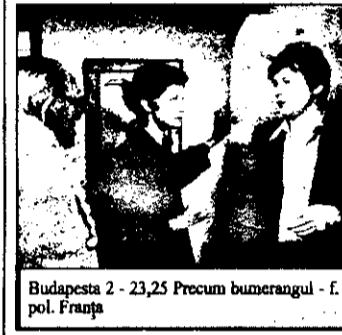
Budapesta 2 - 23,25 Precum bumerangul - f. pol. Franța