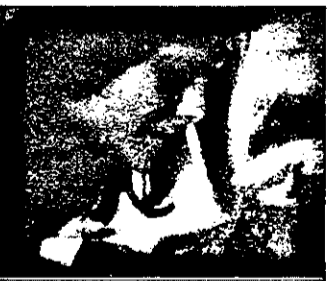
9,55 Pățaniile unui bărbat divorțat - comedie SUA

9,00 Jurnal canadian 9,25 Teatru de marionete 10,00 Corespondent special - magazin 11,30 Muzică 12,30 Noutăți muzicale lirice și coregrafice 13,00 Oaspete la TV5 - sora