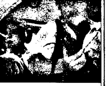
PRO 7 - 23,00 Inferno SUA - film acțiune, SUA

9,00 Jurnal canadian 9,30 Satul dintre nori 9,50 Bibi și Genevieve - serial 10,50 Magazin culinar 11,10 Soluții practice - magazin 11,30 Lumea fotbalului 12,00 Concurs TV