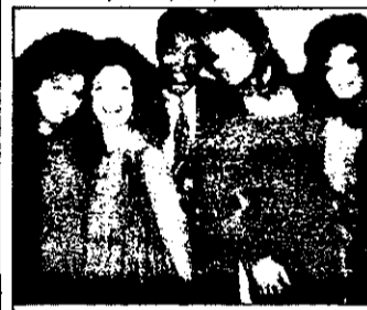
20,00 Designerele - serial distractiv SUA

9,45 Start matinal - magazin 10,00 Hopp sau kopp? - concurs tv 10,30 Sport 13,00 Eșecuri și pățanii