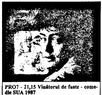
PRO7 - 21,15 Vânătorul de fuste - comedie SUA 1987