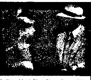
SATI - 23,15 Blue City - f. act. SUA, 1985