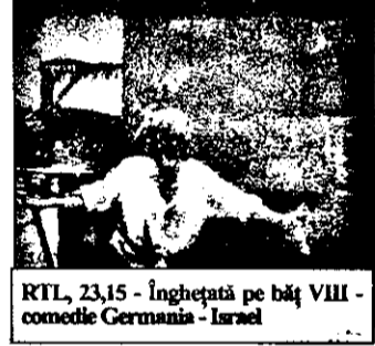
RTL, 23,15 - Înghețată pe băț VIII - comedie germano-israeliană

8,00 Magazin matinal 10,00 Ironside - reluare 11,00 Bogăți și frumosi - serial familial american 11,30 Merită prețul - telegioc 12,00 Riscă - telegioc 12,30 Duel familial-telegioc 13,00 Știri 13,35 Benny Hill show 14,05 Clanul din California - serial familial american 15,00 Wimbledon '93 - tenis Londra 20,10 Explosiv! - magazin 21,15 Muzică și umor 22,10 Intâmplări din Syllti - serial german 23,15 Înghețată pe băț - VIII, comedie germano-israeliană