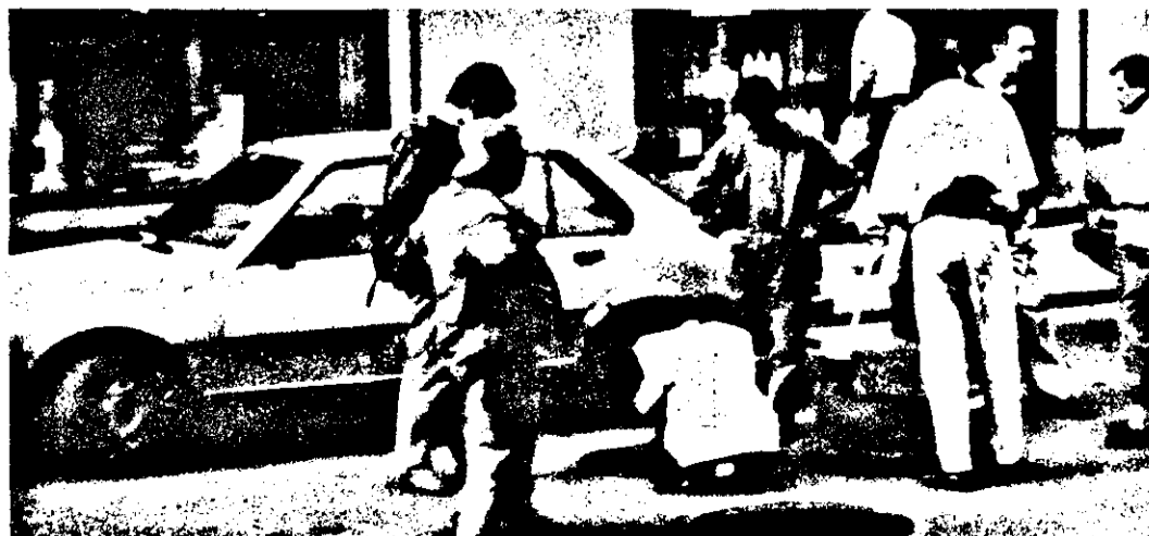
Așa-i la noi: unul cu sapa, restul cu mapa...