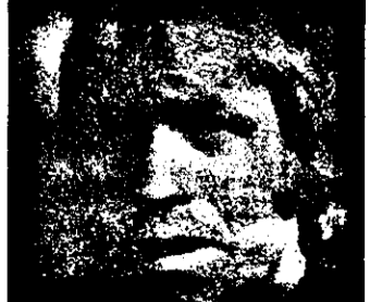
PRO 7 - 0,15 Legea tăcerii - I acțiune SUA, 1985, cu Chuck Norris

7,30 Magazin matinal 9,00 Jurnal canadian 9,30 Știri pentru vacanță 10,00 Zoo-magazin 10,15 Dimineața plăcută! 12,00 Teatrul și literatură 12,30 Concurs tv 13,00 Șansonete 13,45 Jurnal elvețian 14,15 Coșci de banană - serial canadian 14,40 Sport profesionist canadian 15,30 Școala fanilor - concurs 16,15 Frumos și cald - reluare 17,00 Știri TV 5 17,15 Vision 5 17,30 Șansonete de Charles Trenet 19,30 Știri