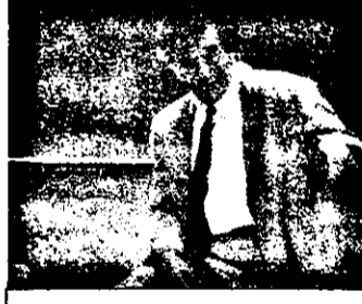
21,15 Colombo - serial polițist SUA, 1991

7,15 Desene animate 10,35 Lassic - serial american 11,00 Ruck-Zuck - telejoc