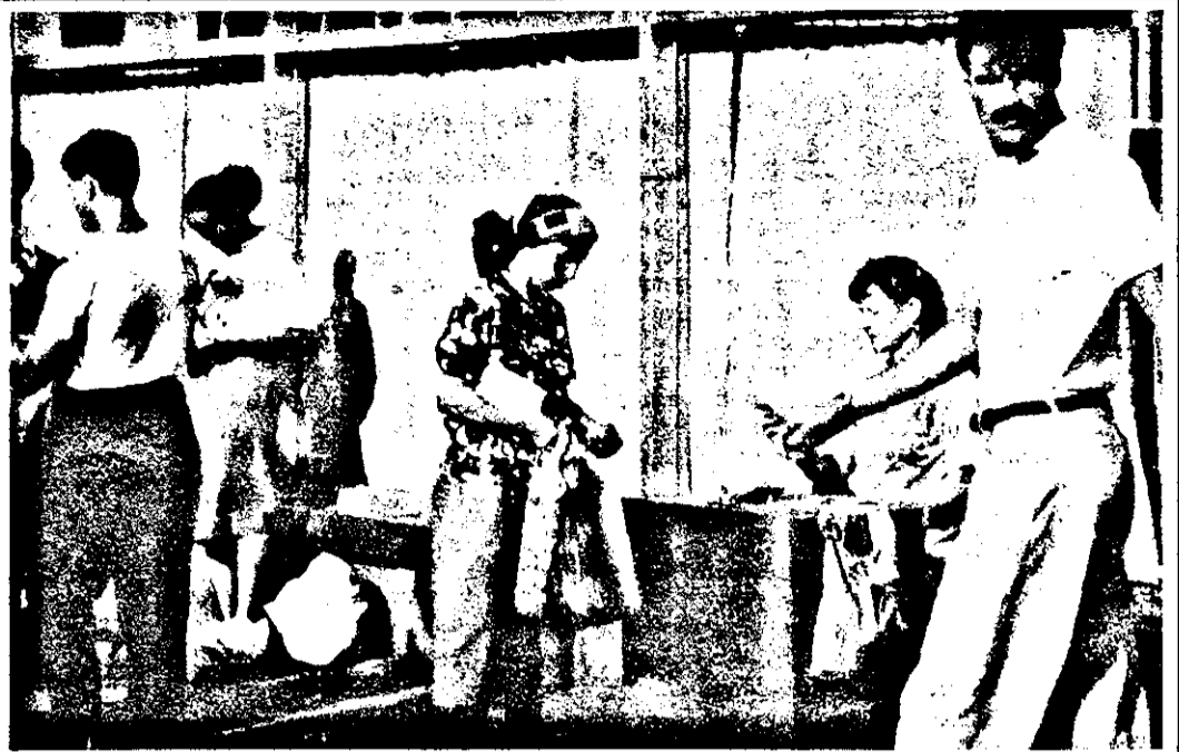
„Cu ultimii 50 de lei să iau un loz. Dacă pe lângă atâtea neazuri voi avea parte și de un strop de noroc?”