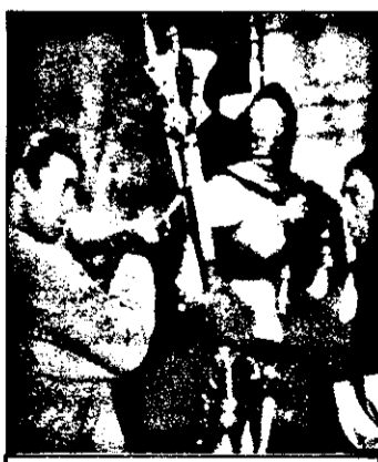
RTL 21,15 Highlander - s. acțiune SUA