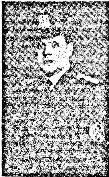
N. CORNĂTEANU földművelésügyi miniszter

A földművelésügyi miniszterium becslése szerint az évi buza-terméshozam 390 ezer vagonra tehető. Olyan bőség ez, amelyet csak a legjobb esztendőket eddig. A földművelésügyi miniszterium tanácsai alapján a bevetett területek felülete jelentősen meg-