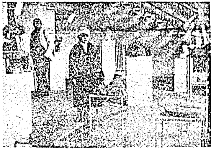
Aspect de la primul „Salon biennial de sculptură mică” deschis în sala „Arta” din Arad.