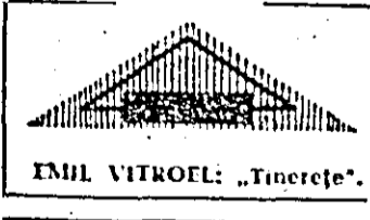
EMIL VITROEL: „Tinerete“.