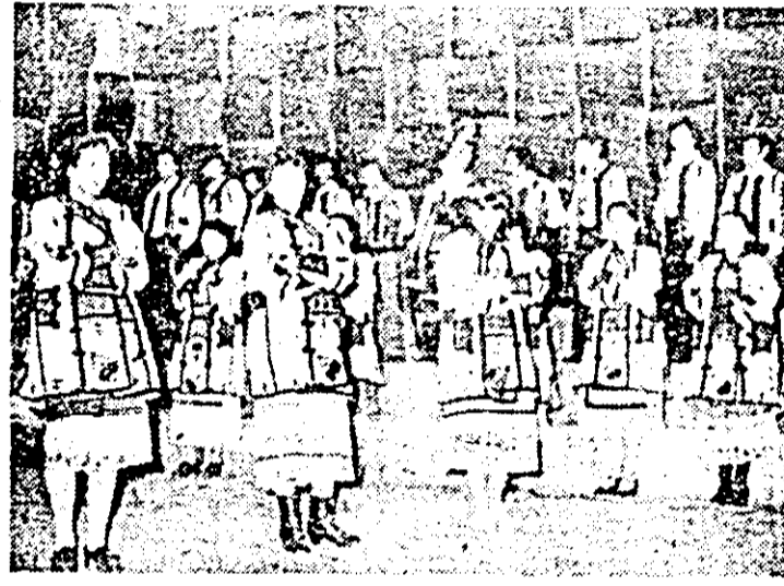
Inefabilul datinilor și obiceiurilor populare românești de iarnă a fost surprins, nu demult, într-un fcehic spectacol prezentat de artiștii amatori, elevi ai Școlii populare de artă.