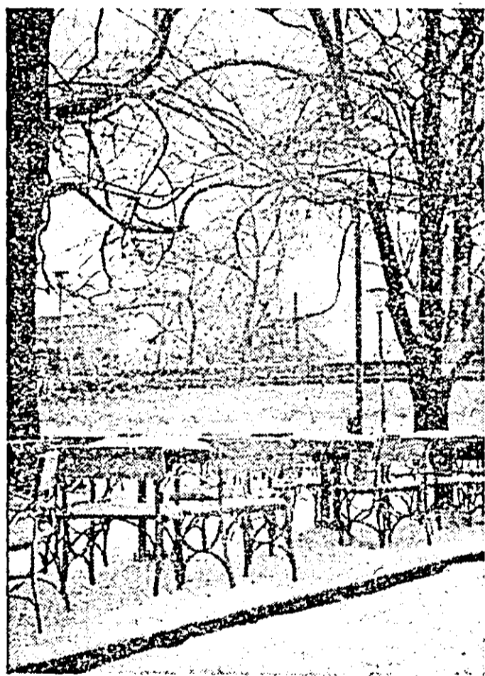
Simfonic în alb.

Ce s-ar putea spune în concluzie? Că preocupările pentru ridicarea competitivității vagoanelor românești sub toate aspectele sînt meritorii. Dar rezultatele nu se ridică încă la nivelul puternicului potențial de care dispune alți centrul de cercetări cit și întreprinderea. Cu alte cuvinte, eficiența, ca rod al îmbinării organice a cercetării cu producția, poate fi încă mult sporită.