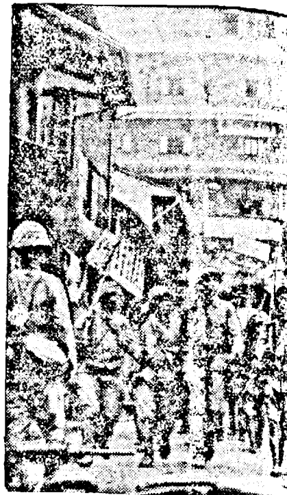
Soldați italieni într'un oraș din Italia

Armata bolșevică poate să fie puternică în timpuri de pace și bine înarmată. Dar cum se prezintă această înarmare după ce s'a făcut mobilizarea generală? Soldatul rus este curajos și rezistent în apărare. Dar la ce înălțime se află conducerea de războiu sovietică, ne-au dovedit eșecurile în luptele de iarnă pe frontul finlandez. Reformele întreprinse după supărătoarele experiențe din Karelia s'au întreprins unele reformele radicale în cadrul armatei sovietice ca reînnoirea la organizare unitară a conducerii, întărirea disciplinei, schimbarea tehnicii de luptă în conformitate cu necesitățile războiului modern, și în sfârșit încercarea disperată de a convinge soldatul sovietic că luptând pentru Rusia, pentru pământul sfânt al patriei sale, dar fără îndoială că acestea au venit prea târziu și nu pot avea încă urmări eficiente.