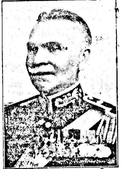
Di General Gh. Argeșanu, ministrul Apărării Naționale.

Capitolul de educație morală: Rege, drapel, abnegație, sacrificiu, dragoste — ce șefi trebuie să cadă în sarcina edu-