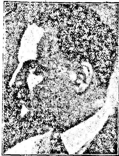
Di Mihail Ghelmegeanu, ministrul Lucrărilor Publice.

de șosea va costa maximum 500.000 lei. Totalul sumei înscrisă în bugetul drumurilor din acest an, se ridică la 500 milioane lei.